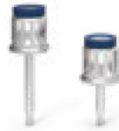
1.25 Torque Hex Driver