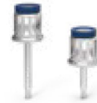
1.25 Torque Hex Driver